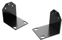
DW-G419RE Orejetas de montaje en rack de 19"